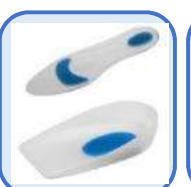
全足矽膠墊 足後跟矽膠墊