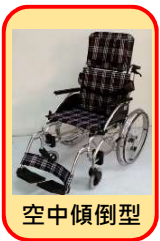
鋁合金高背特製輪椅